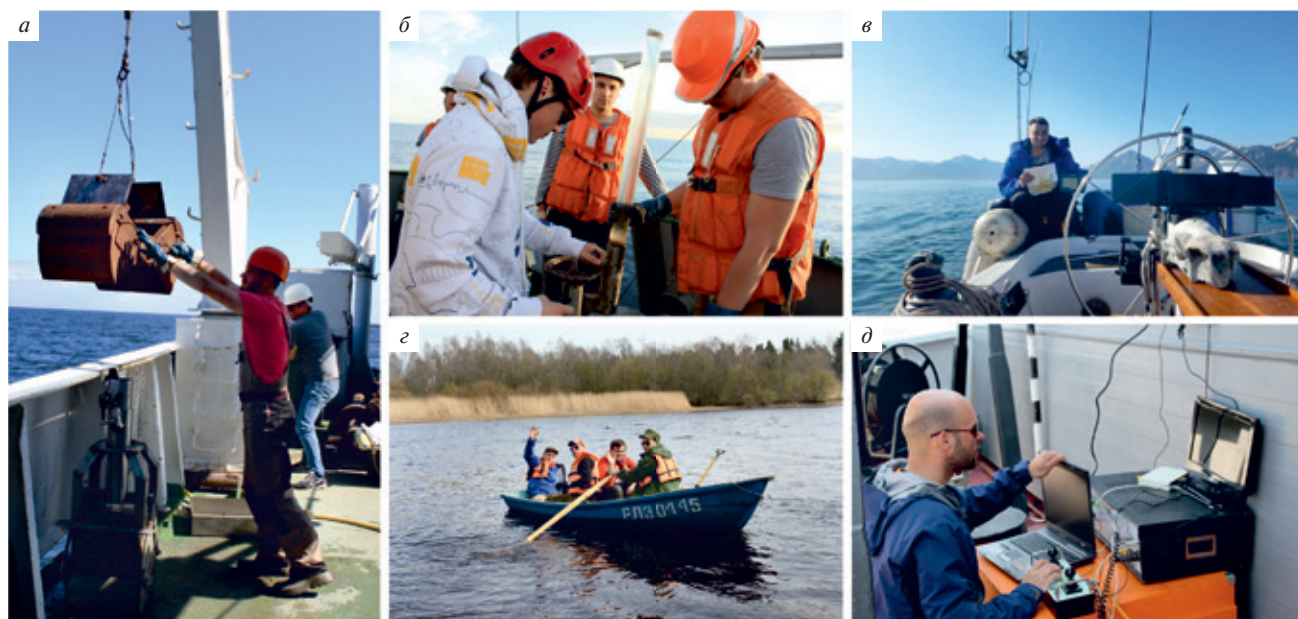
Рис. 3. Экспедиционные будни морской геологии

С 2014 г. морские геологи ВСЕГЕИ участвуют в Международном проекте EMODNet-Geology. Проект был инициирован EuroGeoSurvey, в настоящее время участниками проекта являются 36 организаций (преимущественно, геологические службы) из 30 стран. ВСЕГЕИ осуществляет подготовку картографических материалов по российской части акватории Балтийского, Белого и Баренцева морей. В рамках проекта EMODNet-Geology выполняется создание геологических карт морей Европы (карты дочетвертичных и четвертичных образований, карта донного субстрата – аналог литологической карты донных осадков, карта геологических опасностей, карта минеральных ресурсов, карта береговых процессов и т. д.) по единым методикам и легендам. Проводится работа по стандартизации