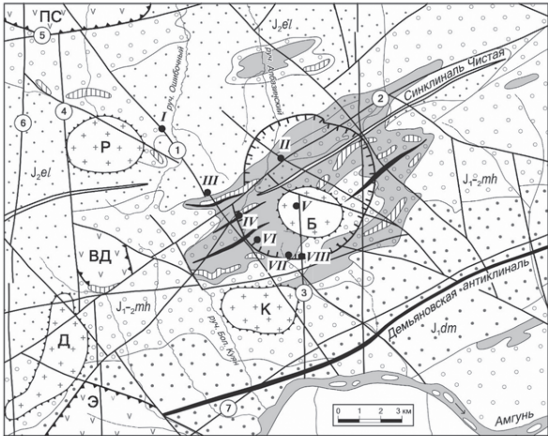
Рис. 2. Структурно-тектоническая схема района Албазинского рудного поля и его флангов

1 – оси антиклиналей; 2 – оси синклиналей; 3 – участки распространения кремнисто-глинистых пород; 4 – участки распространения углеродистых алевролитов (в целом в границах мульды); 5 – разрывные нарушения; 6 – граница предполагаемой палеокальдеры по геофизическим данным; 7 – интрузивно-купольные структуры; 8 – границы палеовулканоструктур; 9 – вулканические породы; 10–12 – юрские терригенные породы (10 – эльгонская, 11 – михалицынская, 12 – демьяновская свиты). Для разломов: 1 – Албазинский, 2 – Ивановский, 3 – Меридиональный, 4 – Даваксинско-Сомнинский, 5 – Сомнинский, 6 – Правосомнинский, 7 – Левоамгунский. Для интрузивно-купольных структур: Д – Даваксинская, К – Куянская, Б – Брусничная, Р – Рябиновая. Для вулканоструктур: ПС – Правосомнинская, ВД – Верхнедаваксинская, Э – Эвурская. Для рудных зон и рудопроявлений: I – Татьянанская, II – Масловская, III – Анфисинская, IV – Ольгинская, V – Брусничное, VI – Екатерининская, VII – Екатерининская-2, VIII – Фаридинская