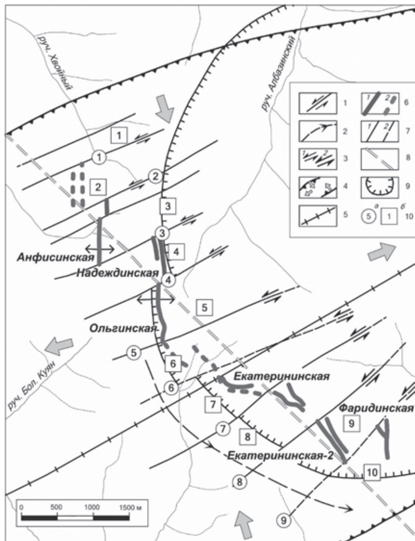
Рис. 3. Схема сдвиговой тектоники Албазинского рудного поля

1 – сдвиговые разломы СВ простирания с указанием направлений движения; 2 – направление ротации блоков; 3 – сдвиги со смещениями: метры – первые десятки метров (1), от нескольких десятков метров до первых сотен метров (2); 4 – эллипс горизонтальных напряжений СВ простирания с направлениями растяжений и сжатий; 5 – ось эллипса напряжений; 6 – основные рудные тела (1), зоны со слабопроявленными признаками золотого оруденения (2); 7 – разломы достоверно доказанные (1), предполагаемые (2); 8 – Албазинский рудоконтролирующий разлом; 9 – границы предполагаемой ВТС (палеокальдеры); 10а – разломы: 1 – Складской, 2 – Сергеевский, 3 – Южноанфисинский, 4 – Ивановский, 5 – Ольгинский, 6 – Южно-Ольгинский, 7 – Екатерининский, 8 – Екатерининский-2, 9 – Фаридинский; 10б – блоки: 1 – Складской, 2 – Североанфисинский, 3 – Анфисинский, 4 – Ивановский, 5 – Ольгинский, 6 – Южно-Ольгинский, 7 – Екатерининский, 8 – Екатерининский-2, 9 – Фаридинский