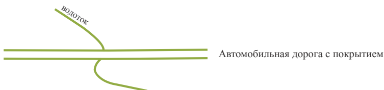
Пример оформления пересечения автомобильной дороги с покрытием и одинарного водотока

3.1.16. Автогужевая дорога показывается на основе следующей классификации: главные дороги (автострада, автомагистраль, шоссе всех видов...); прочие дороги (улучшенная грунтовая и грунтовая всех видов, зимняя, тракторная, полевая, лесная дороги...). Автогужевая дорога доводится до границы населенного пункта.