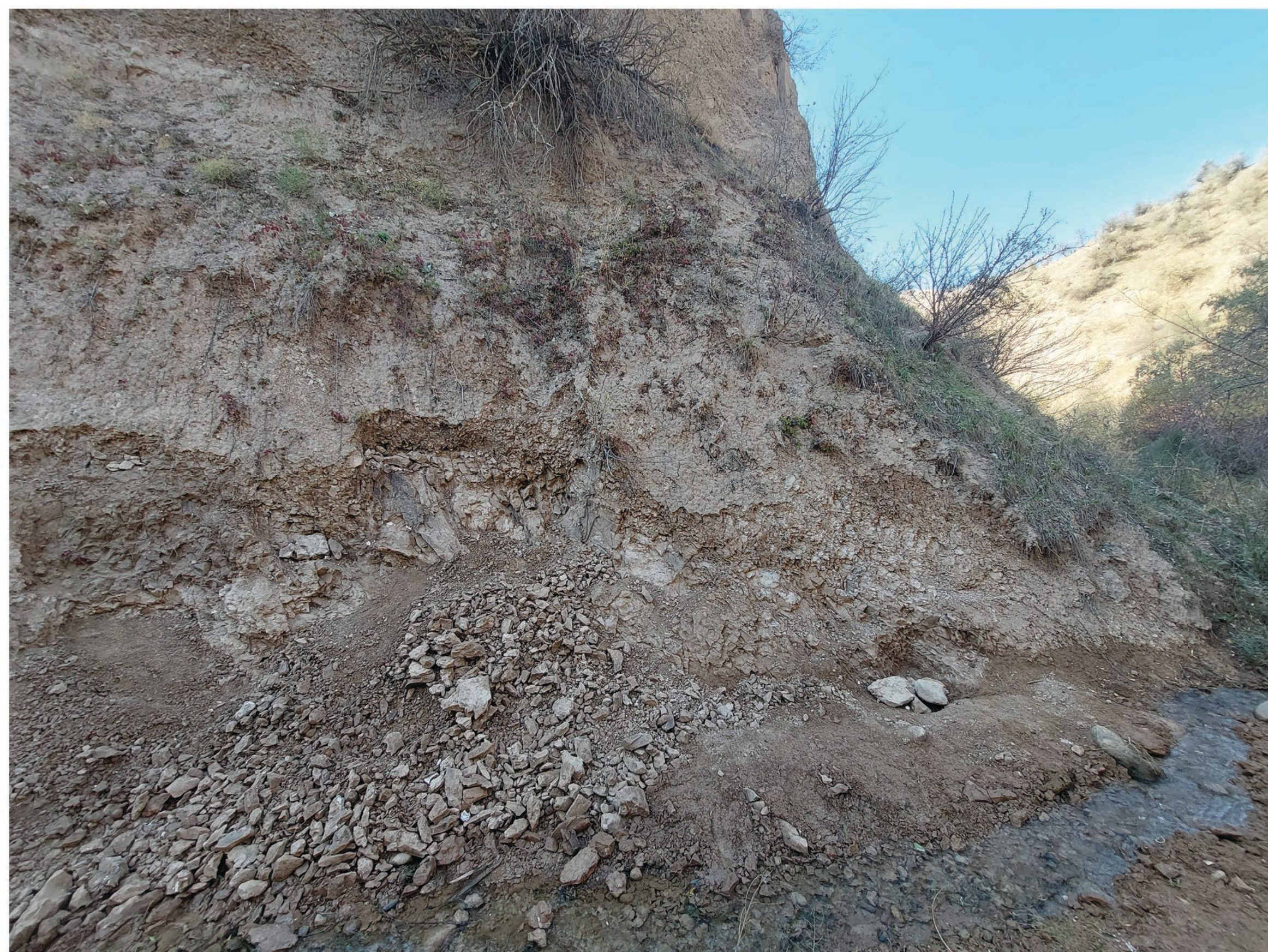
Местонахождение Наврухо (Куруксай)