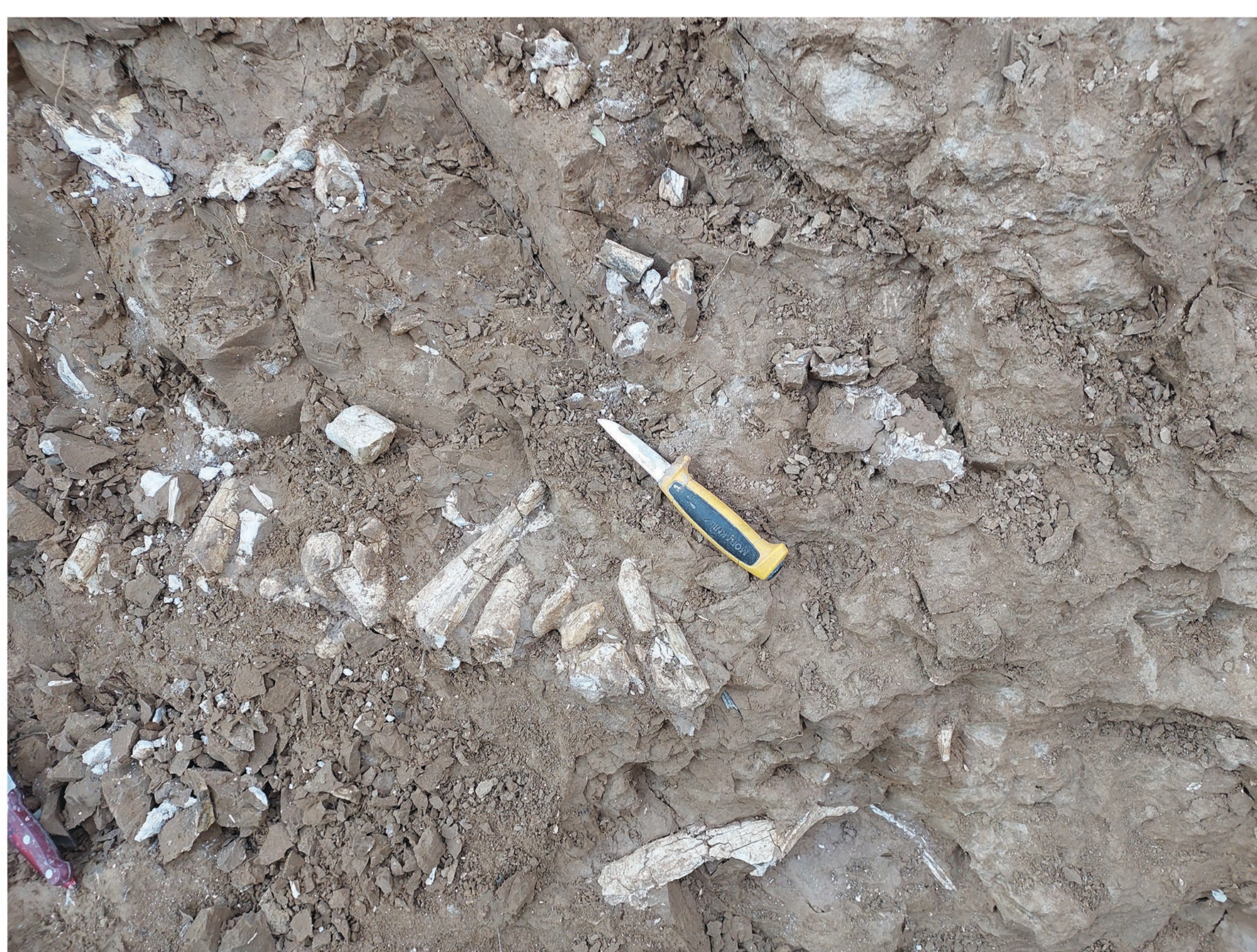
Костеносные слои местонахождения Наврухо