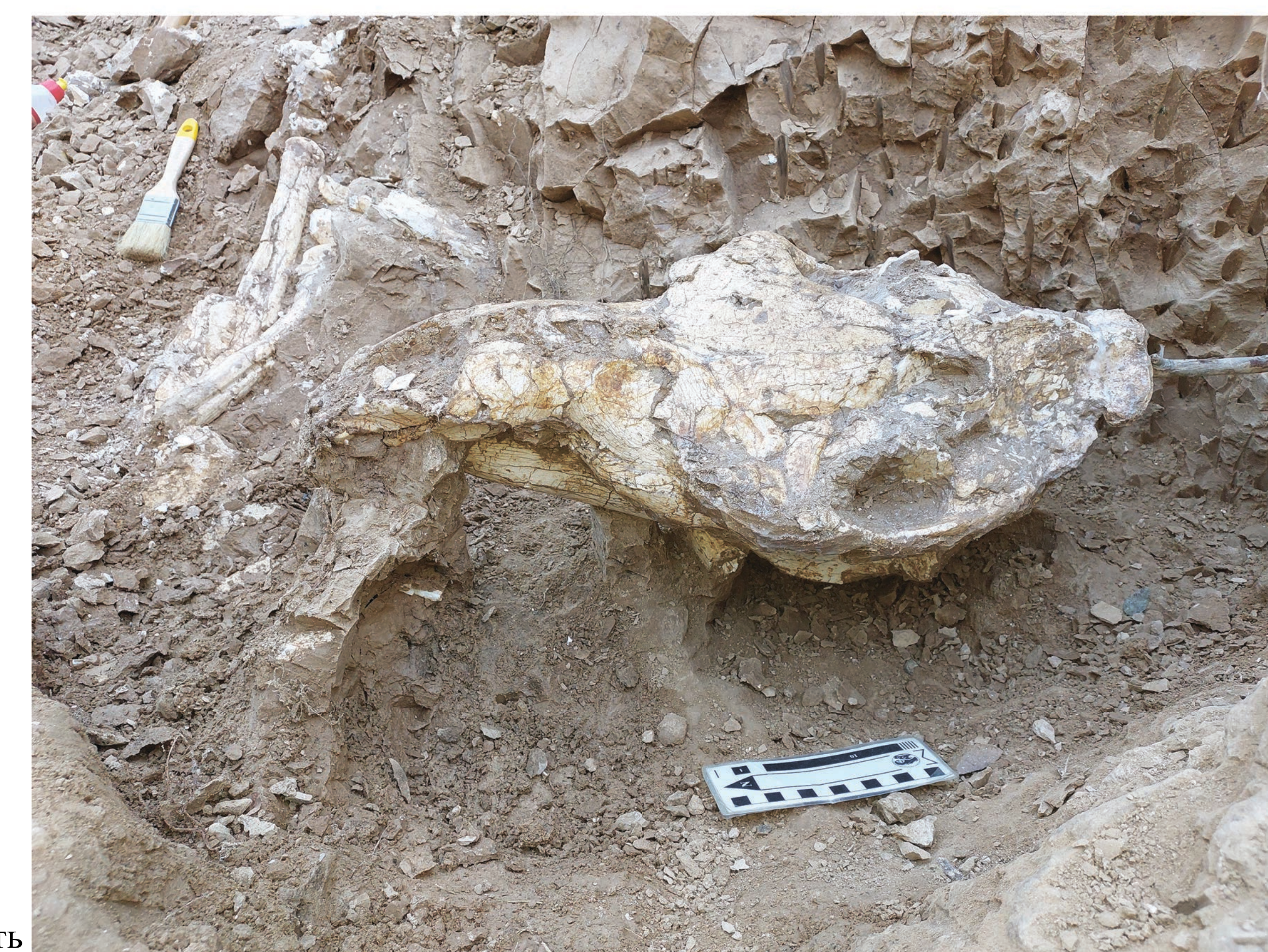
Череп верблюда Paracamelus trofimovi в слое