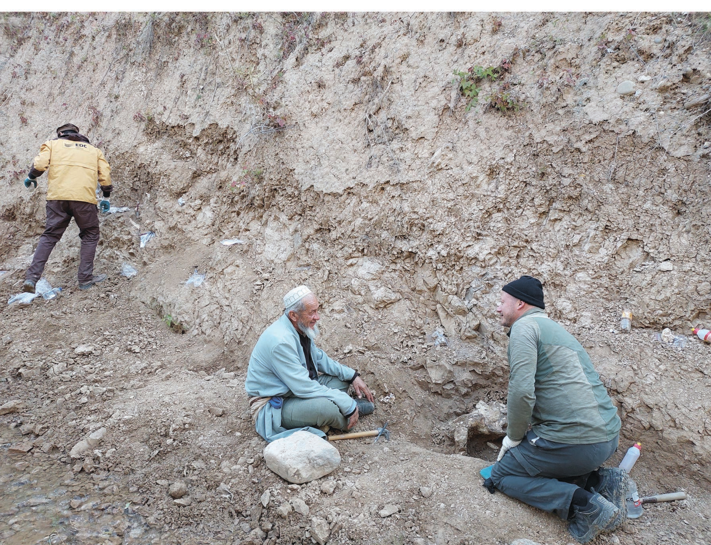
Рабочий момент раскопок