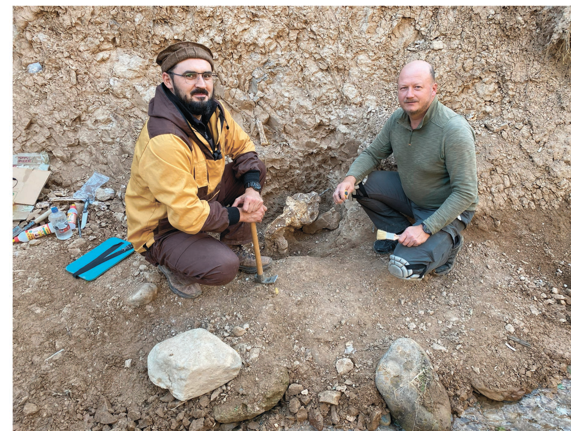
Участники экспедиции возле раскопанного черепа верблюда